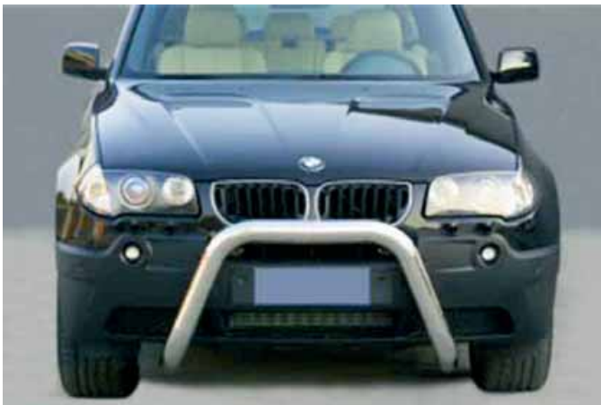
Defensa tipo U inoxidable diámetro 76 mm en un X-3