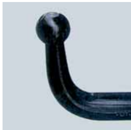
Enganche de remolque