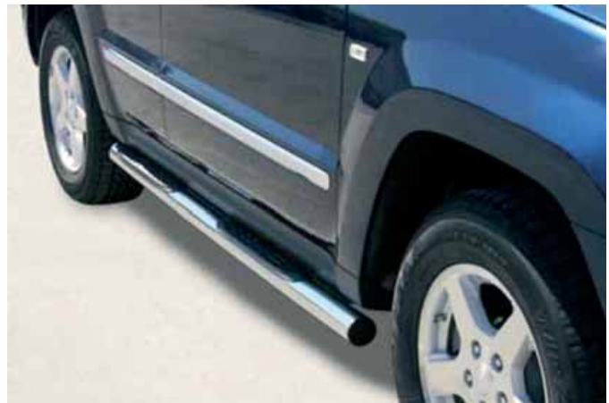
Estribos Combi inoxidables, diámetro 76 para X-3