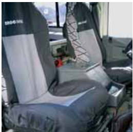
Fundas de asiento delanteras