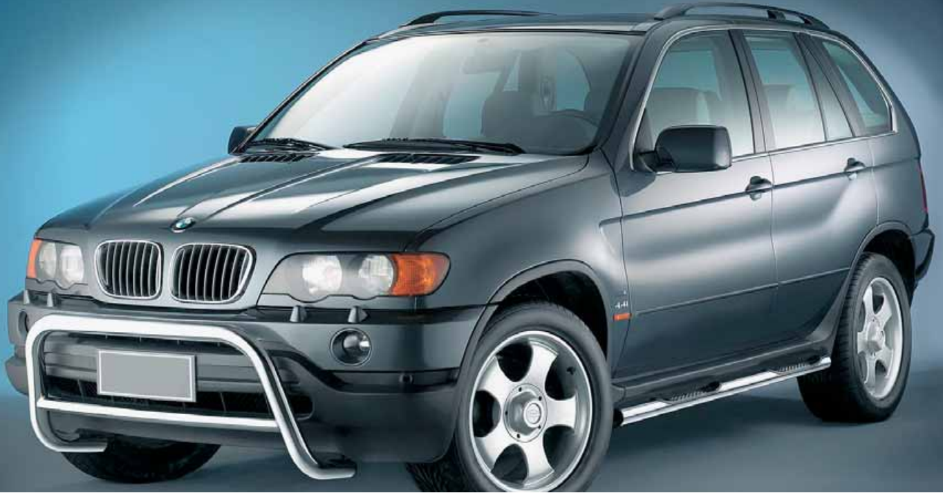
Defensa Big-Bar y estribos acabado inoxidable para X5