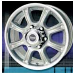
Llanta Performance BB6