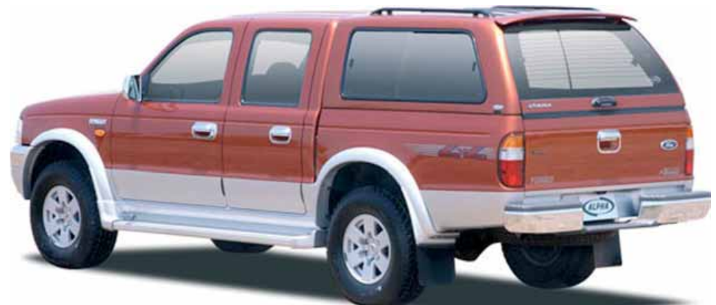
Hard Top Alpha con ventanas instalado en el modelo X-tra cabina