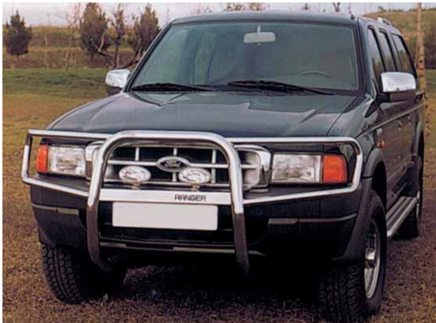
Defensa integral inoxidable