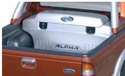
Utility Box Alpha