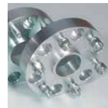
Separadores de rueda