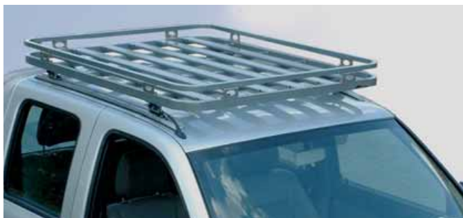
Baca de aluminio African Outback