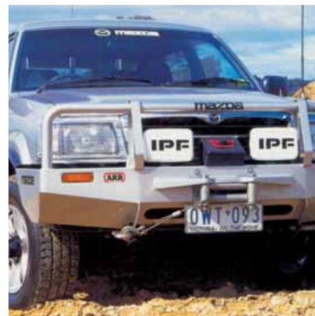
Winch Bar ARB