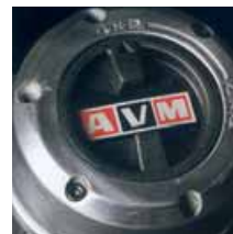
Liberadores de rueda