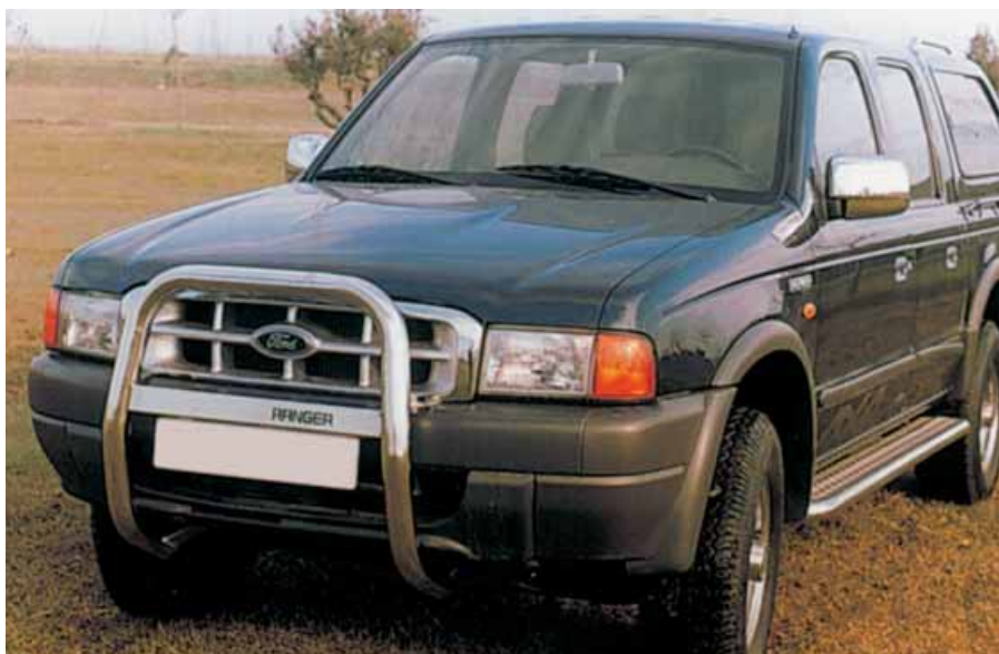
Big-Bar delantero acabado inoxidable