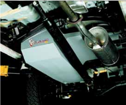
Depósito de reemplazo