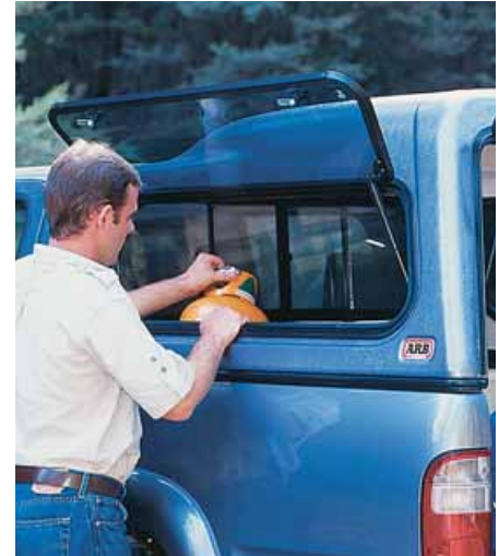
Opción ventanas elevables