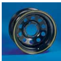
Llantas Mangels Modular acero blanca, cromada y negra