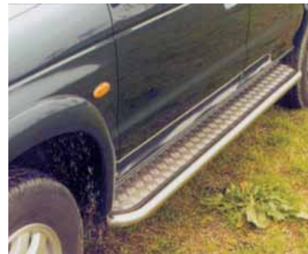
Estribos plataforma inox.