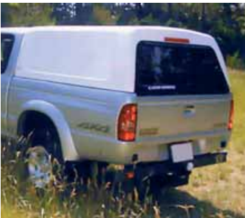
Hard Top Alpha sin ventanas