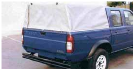
Toldo con arcos