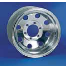
Llanta American Eagle