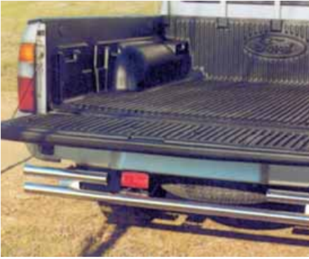
Parachoques trasero de doble tubo inoxidable