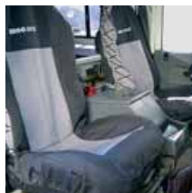
Fundas de asiento