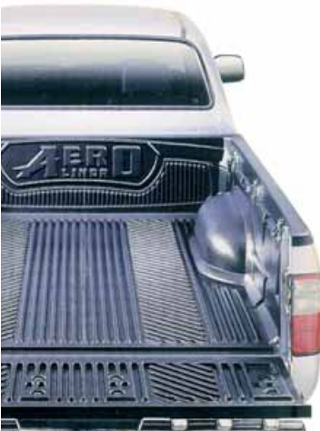
Protección de caja Bedliner