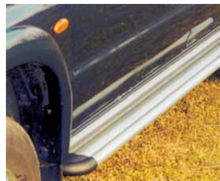
Estribos laterales de aluminio