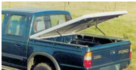
Tapa de caja Sport-Lid