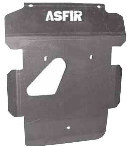
Protectores de bajos