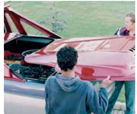
Tapa de caja Full Box desmontable