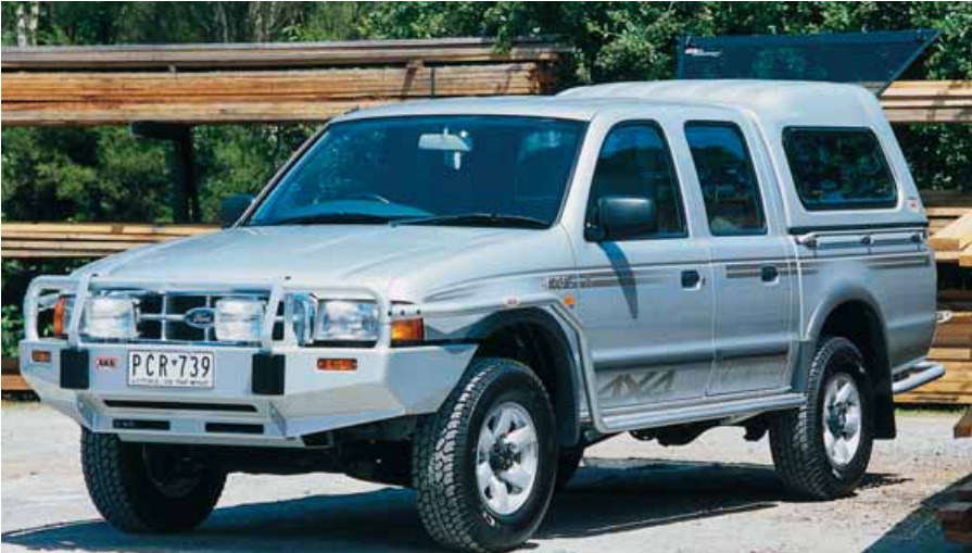
Hard Top T-Top alto con ventanas para X-tra cabina