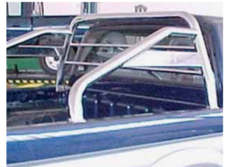
Roll-Bar acabado inoxidable