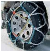
Cadenas de nieve