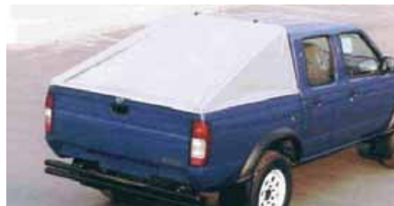
Toldo en cuña