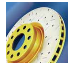
Discos de freno