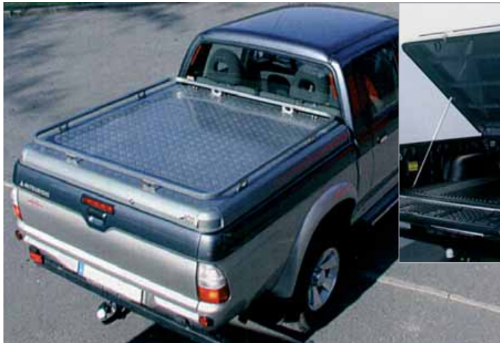
Tapa de caja de carga Smartop