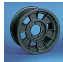
Llantas Performance TX blanca, gris y antracita