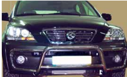
Defensa integral inoxidable modelo bajo