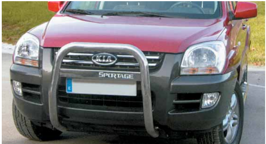
Defensa Big-Bar en inoxidable