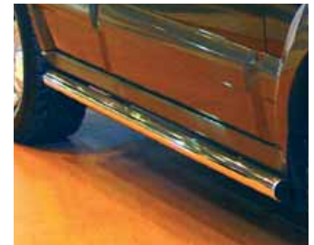
Estribos laterales de tubo inox.