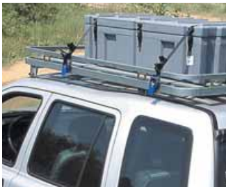
Baca African Outback