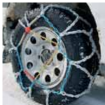
Cadenas de nieve