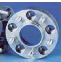
Separadores de rueda