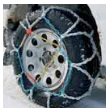
Cadenas de nieve