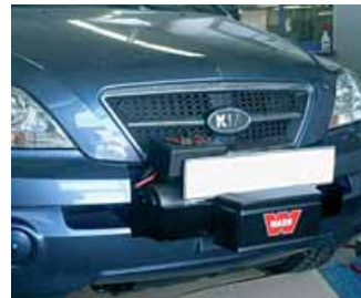
Soporte de winch