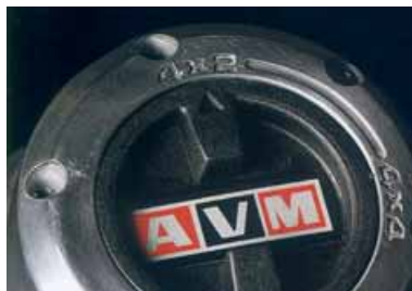
Liberadores de rueda AVM