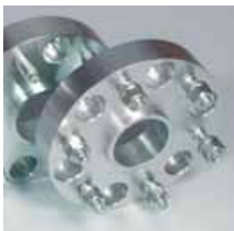
Separadores de rueda