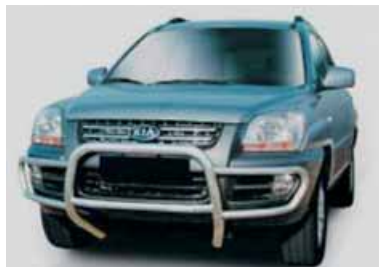
Defensa integral modelo bajo en inoxidable