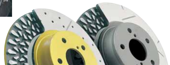
Discos de freno deportivos