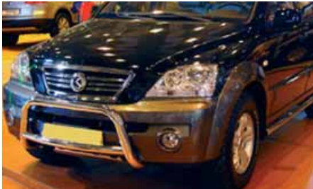
Defensa Big-Bar inoxidable