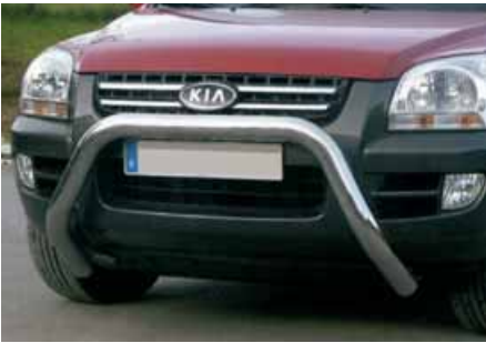
Defensa Big-Bar baja en inoxidable diám. 70 mm