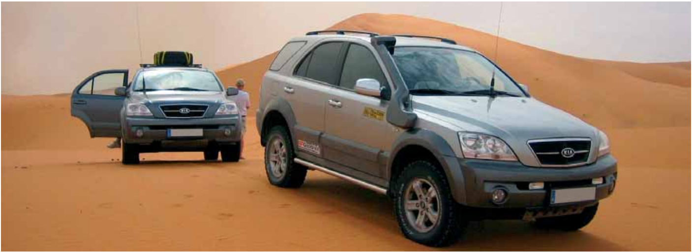
Snorkel montado en un Kia Sorento