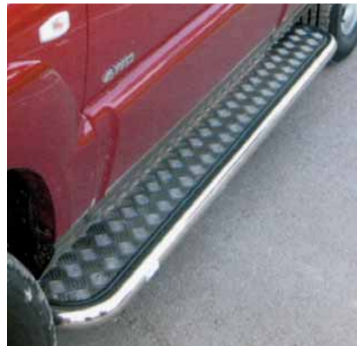
Estribos laterales en inoxidable