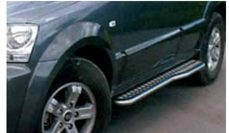
Estribos de plataforma acabado inoxidable