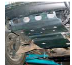
Protectores de bajos